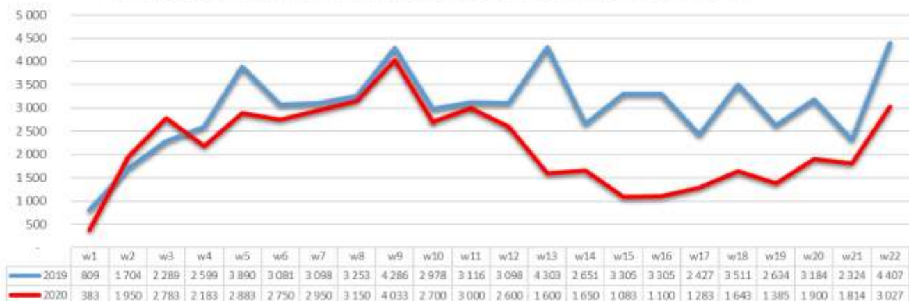
Duna House Tranzakciószám becslés- heti bontásban 2019 vs 2020

A heti adatok vizsgálata továbbra is erősíti a fokozatosan visszazáró tendenciát, május utolsó heteiben a tranzakciós adatokban már csak 22-31%-os volt az elmaradás a tavalyi hasonló időszakhoz képest.